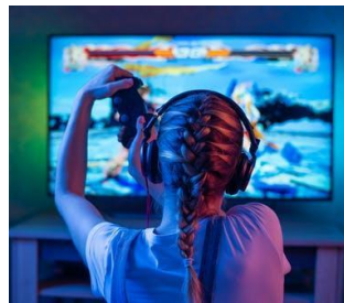
GAMIFICATION, VIDEO, ESERCITAZIONI