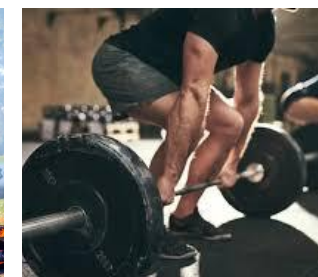
ESERCITAZIONI E ALLENAMENTI PRATICI