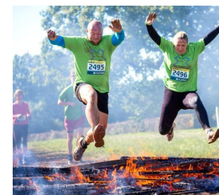
LAVORI DI GRUPPO