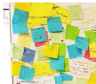
CONDIVISIONE, STUDIO DI CASI E AUTOCASI