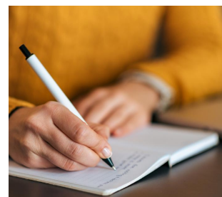
LAVORI INDIVIDUALI E STORYTELLING