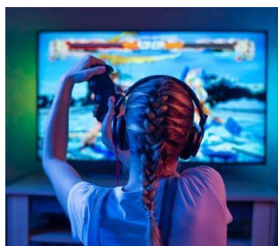
GAMIFICATION, VIDEO, ESERCITAZIONI