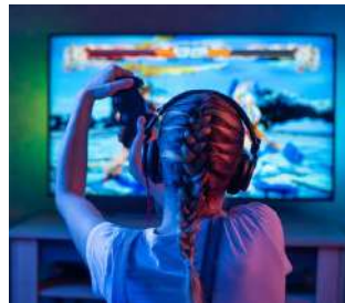
GAMIFICATION, VIDEO, ESERCITAZIONI