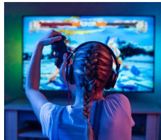
GAMIFICATION, VIDEO, ESERCITAZIONI