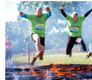
LAVORI DI GRUPPO