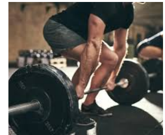
ESERCITAZIONI E ALLENAMENTI PRATICI