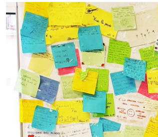
CONDIVISIONE, STUDIO DI CASI E AUTOCASI