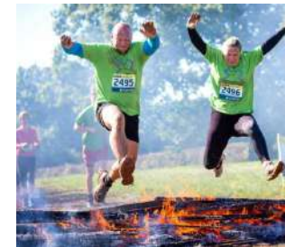
LAVORI DI GRUPPO