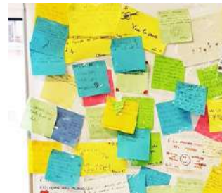
CONDIVISIONE, STUDIO DI CASI E AUTOCASI