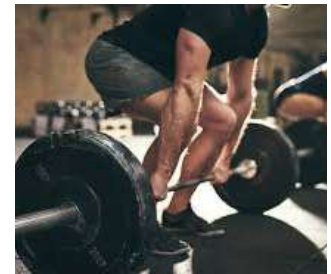
ESERCITAZIONI E ALLENAMENTI PRATICI