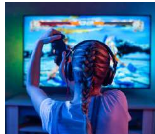
GAMIFICATION, VIDEO, ESERCITAZIONI