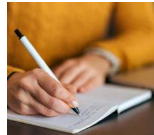
LAVORI INDIVIDUALI E STORYTELLING