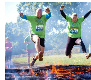
LAVORI DI GRUPPO